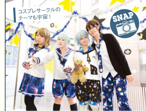
コスプレサークルのテーマも宇宙!