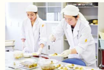
試食のパンやお弁当を取り分ける学生たち

企画から試作、販売コンセプト、パッケージデザインまで、すべてに学生たちの感性やアイデアを盛り込んで新商品を生み出す、山崎製パン株式会社松戸工場と和洋女子大学の共同プロジェクト(YWP)。このプロジェクトが立ち上がったのは、2011年2月。あれから5年、今年度は3種類のパンとお弁当の計4品が商品化されました。今年度の商品企画に携わったのは、健康栄養学類と家政福祉学類の学生24名。この5年間で延べ125名の学生たちがこのプロジェクトに関わっています。工場の製造工程や厳しい衛生管理といった様々な制約がある中で、学生ならではのユニークで