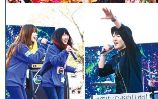
4年生バンドの「I rid」! 大盛り上がりでした!