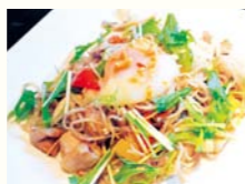
やみつきキノコたっぷり秋を感じるそばバスタ