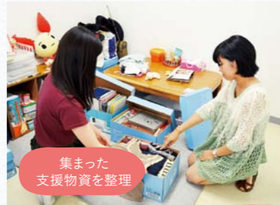
集まった支援物資を整理

7月、学内に呼びかけて不要となった衣類や文房具類を集め、フィリピンの子供達へ支援物資として送る海外支援活動を行いました。集まった物資は、衣類がダンボール7箱、文房具類などが2箱。公益財団法人オイスカ(OISCA)を通して寄付しました。