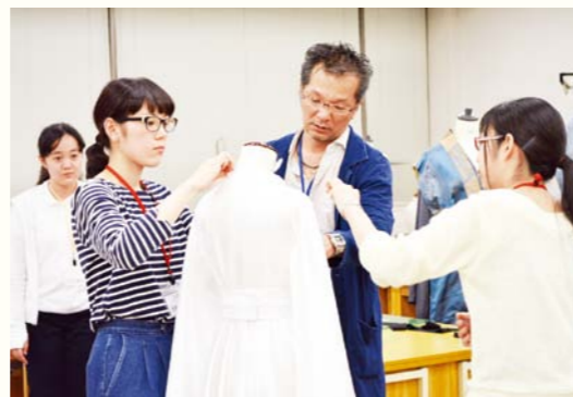
監督と衣裳のイメージについて話し合う学生たち

服飾造形学類の学生たちが、ふるいちやすし監督の新作映画『千年の糸姫』の主要登場人物の衣裳デザインと制作を担当しました。監督との初顔合わせの場で「学生ならではの斬新なアイデアを採り入れて、作品にふさわしい衣裳を考案して欲しい」という言葉を頂き、プロジェクトは7月からスタート。学生たちはシナリオを読み込み、監督とのミーティングを経て、デザイン案を提出。監督とイメージのすり合わせをしながら、夏休みを使って制作に挑みました。参加した学生は1~4年生の20名。イメージ通りの生地がなければ、生地を染めたり燃やしたり漂白したり。素材づくりにも工夫を凝らしました。映画は2016年公開、国際映画祭にエントリー予定です。ぜひ、ご覧ください。