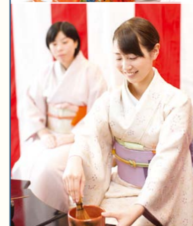
茶道に華道。和の道のWayo girl