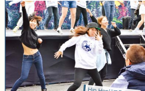
Hip Hopにフラメンコ! 本格的なステージ