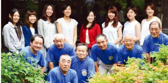
やちよ蕎麦の会の皆さんと学生たち