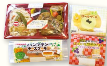
お弁当はディーヤマザキとのコラボです