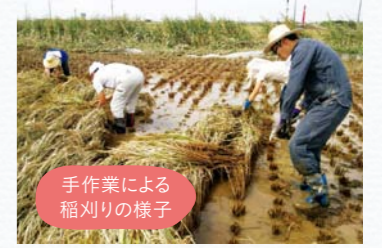
手作業による稲刈りの様子

9月、東邦大学ボランティア部と合同で茨城県常総市のボランティアに行きました。台風の被害で稲刈り機械などが浸水してしまったため、現地では主に農家の稲刈りをお手伝い。作業は想像以上に重労働でしたが、農家の皆さんに良くしていただき、気持ちよくボランティア活動をさせていただきました。また、東北支援活動の一環として、「東北の人々を助けたいけど、何をしたいのかわからない」といった学生たちのきっかけになればと、宮城県の被災地へ赴き、語り部の方のお話を伺うボランティアツアーなども実施しました。