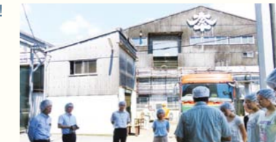
学生たちは8月初旬、醤油と煎餅について学ぶために、タイハイ(株)の工場で醤油製造工程の見学、(有)小島米菓の工場で煎餅製造工程の見学と焼き方の講習を受けました