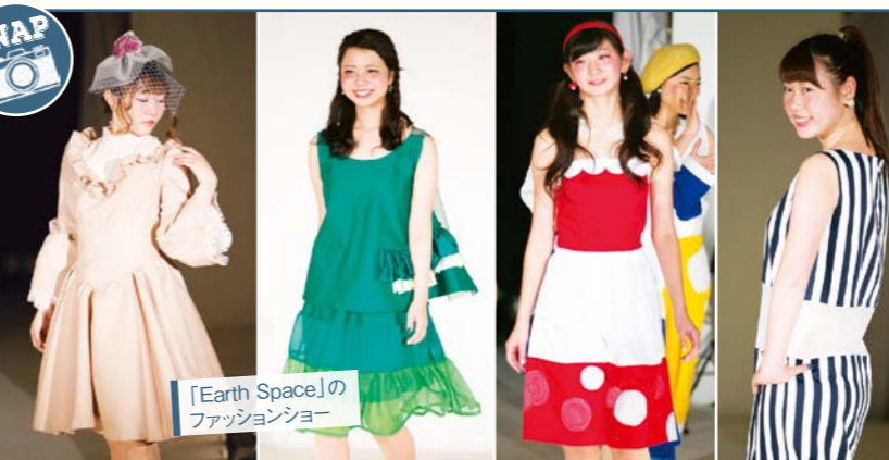
「Earth Space」のファッションショー