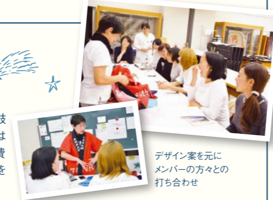
デザイン案を元にメンバーの方々の打ち合わせ

服飾造形学類の専門教育科目「現代きもの設計」(2年後期)を受講する学生13名が、手児奈太鼓の演奏時の衣裳制作を依頼され、14着の衣裳制作を授業内の一環として行っています。学生たちは制作にあたり、体の動きや、使用頻度、洗濯回数、好みの色、装飾や楽曲イメージなどを情報収集。費用についても話し合い、予算を組んだ上で、デザインや素材選びを行い、実務に即した流れで制作を開始。衣裳は来年3月20日、市川市民会館で開催される定期演奏会でお披露目の予定です。